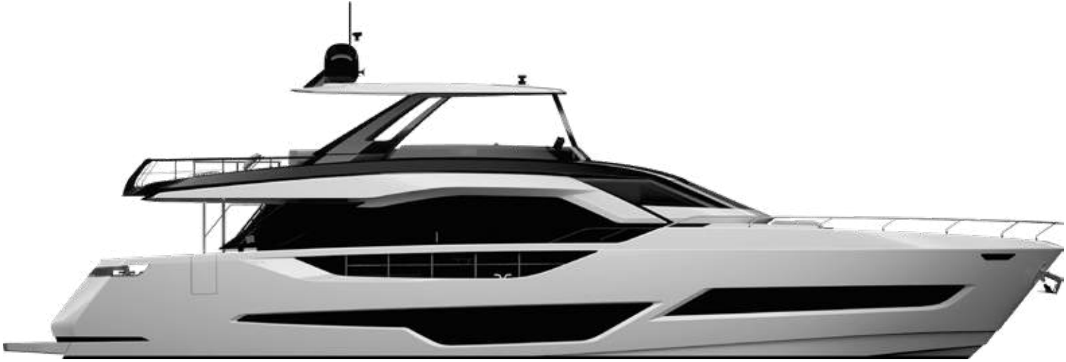
PROFILE – OPT

The Technical data, performances, designs and graphic reproductions are purely indicative, are not contractual, shall not constitute in any circumstances whatsoever any contractual offer by the shipyard and refer to European standard models of motor yachts built by the shipyard. The only valid technical reference or description is the specific parameters of each motor yacht cited only on purchase of the same. Therefore the only indications binding on the seller are contained solely in the sale agreement and in the relevant specific manual.