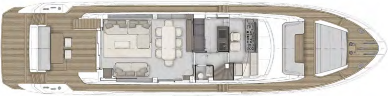
MAIN DECK OPTIONAL 2