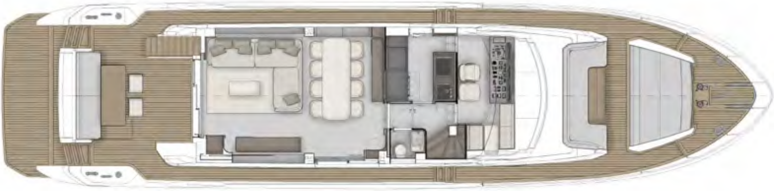
MAIN DECK OPTIONAL 1