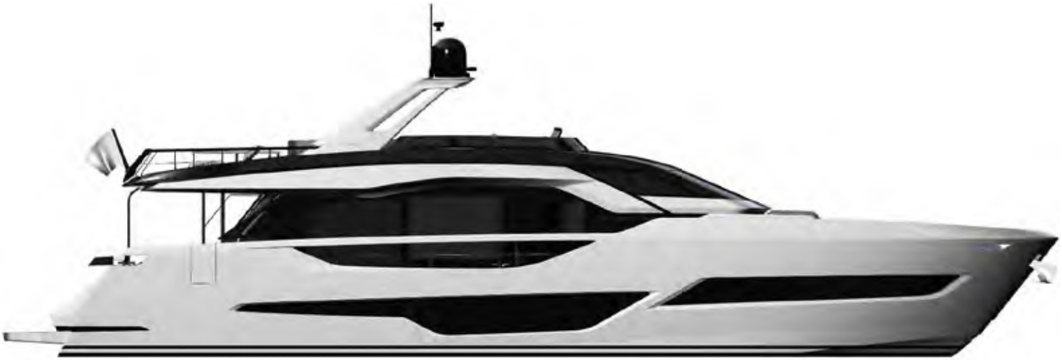
PROFILE – STD

STD 2 x MAN V12 1550 Potenza 1550 mhp / 1139 kW a 2300 g/min